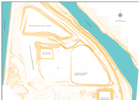
STATO ATTUALE DEL SITO

La bonifica permetterà una sistemazione integrale della zona a nord dell'area Casotte nella quale saranno recuperati ulteriori spazi per futuri insediamenti produttivi.